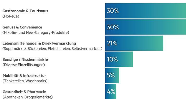
BRANCHENVERTEILUNG UKO MICROSHOPS

UKO richtet sich an Unternehmen, die automatisierte, skalierbare 24/7-Vertriebslösungen suchen – mit Fokus auf Service, Verlässlichkeit und digitale Bezahlssysteme. Die UKO-Microshops fungieren nicht mehr als klassische Automaten, sondern als vollwertige Vertriebskanäle für unterschiedlichste Produkte und Märkte.